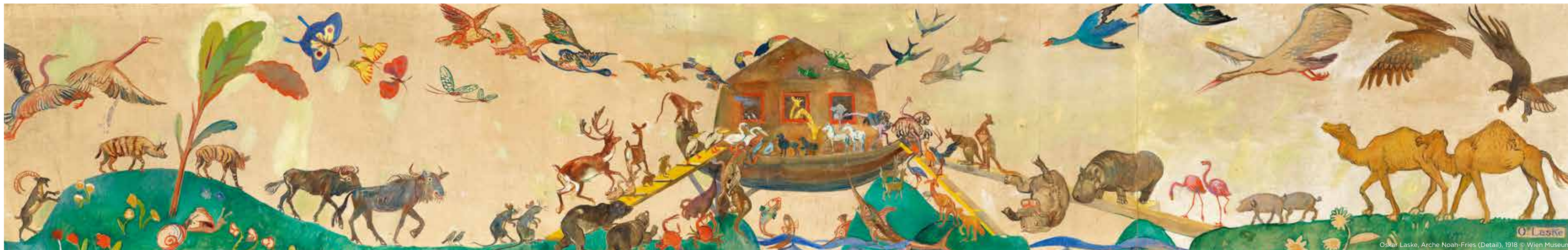
Oskar Laske, Arche Noah-Fries (Detail), 1918