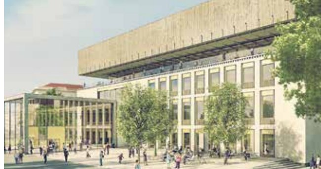
Rendering Frontansicht Wien Museum Neu © CWR ARCHITEKTEN