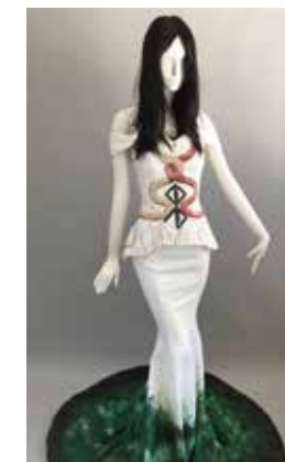
Kleid von Conchita Wurst, Life Ball 2014

On the occasion of the 100th anniversary of the founding of Austria's Republic, we show ten objects from the Wien Museum collection – each of them emblematic for one of the ten decades of modern Austria's history.