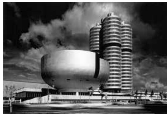
Karl Schwanzer, BMW-Zentrale in München, 1973, Foto: Sigrid Neubert © Wien Museum / Karl Schwanzer Archiv

With the donation of Karl Schwanzer's archive in May 2018, the Wien Museum expanded its with one of 20th century Austria's most important architectural estates. On view here are three of the architect's major works, in Vienna, Munich and Brasilia.