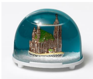
Schneekugel mit Stephansdom-Motiv, um 2008, Foto: Birgit und Peter Kainz