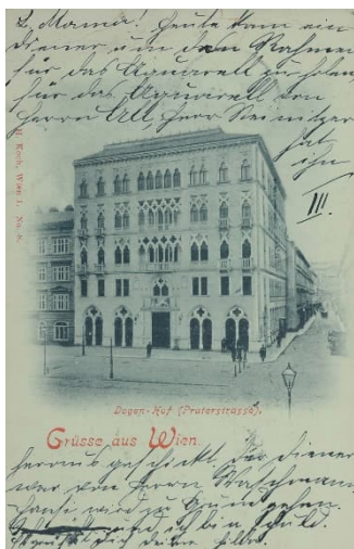
Ansichtskarte: Grüße aus Wien. Dogenhof, um 1899, Foto: Wien Museum

Termin: Dienstag, 19. November, 17 Uhr Treffpunkt: Wien Museum Karlsplatz, Foyer Dauer: ca. 60 Minuten