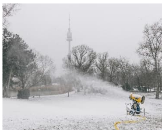
Klaus Pichler: Schneekanone am Kaffeehausberg, Donaupark, 2014

Termin: Dienstag, 17. Dezember, 16 Uhr Ort: Wien Museum Karlsplatz, 4. Stock