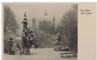
Ansichtskarte: Ein frohes Neues Jahr! Karlskirche im Winter, 1939