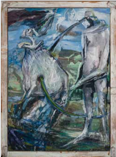
Siegfried Anzinger Ochs und Vogelspinne, 1986, Eitempera auf Leinwand egg tempera on canvas, 140 x 100 cm

In den 1980er Jahren gelang es der Kulturabteilung, eine allmähliche Professionalisierung im Sammlungsmanagement herbei zu führen. Die Berufung einer Ankaufsjury, die ab 1986 mehrmals jährlich Empfehlungen für die Ankäufe abgab, ist ein Meilenstein in der Sammlungsgeschichte des MUSA.