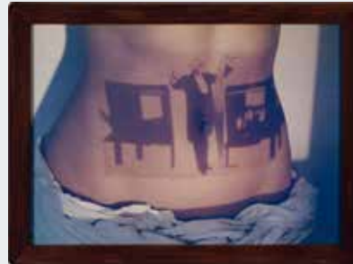
Birgit Jürgenssen Körperprojektion (Der Magier Houdini), 1988, Farbfoto | colour photograph, 50 x 70 cm