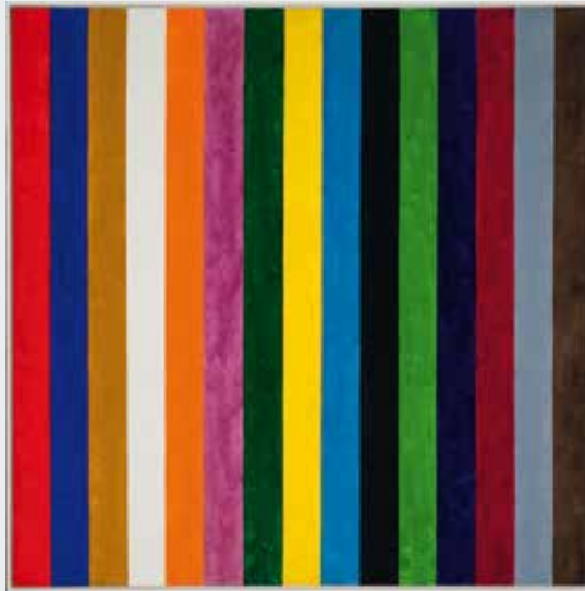
Heimo Zobernig Ohne Titel, 1988, Öl auf Leinwand oil on canvas, 100 x 100 cm