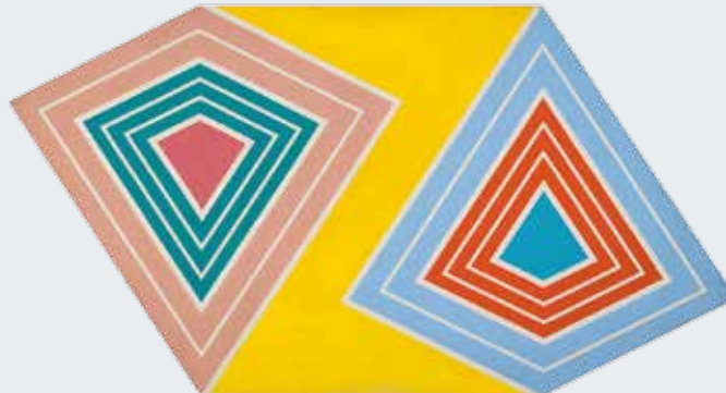
Tim Sharp A system of double insecurity, 1980, Acryl und Alkyde auf Leinwand auf Hartfaserplatte gespannt | acrylic and alkyds on canvas mounted on hardboard, 6-eckig | hexagonal, 96 x 185 cm