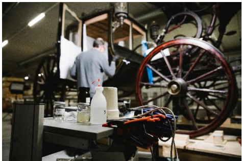
Großer Galawagen