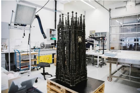
Modell von St. Stephan, Foto: Ina Aydogan

www.wienmuseum.at/de/veranstaltungen.html > filtern nach: „Art“ > „Verein der Freunde ...“ > den gewünschten Termin auswählen