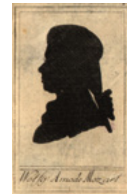
→ ヒエロニムス・レッシェンコール: ヴォルフガング・アマデウス・モーツァルト、1785年、銅版によるシルエット

新たなベートーヴェン・ミュージアムでは、古典派の巨匠の生涯と作品が、最新の研究レベルで紹介されています。この家は、ベートーヴェンの過酷な運命と結び付いています。1802年、ここで彼は「ハイリゲンシュタットの遺書」を記しました。これは弟たちに宛てた手紙で、悪化する難聴に対する絶望が語られています。結局発送されることはありませんでした。ここで同じ時期にベートーヴェンは、最も重要な作品の幾つかに取り組んでいました。その中には、ピアノソナタ「テンペスト」や交響曲第3番(「エロイカ」)の最初の草稿が含まれています。