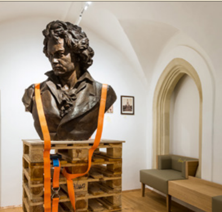
↑ 写真: ヘルタ・フルナウス ↓ 写真: ラステル・リサ