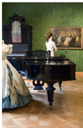
↑ 写真: ヘルタ・フルナウス

ヨハン・シュトラウス(息子)は1860年代半ばから1870年代半ばまで、瀟洒でエレガントなプラーターシュトララーセに住んでいました。人気絶頂期に、彼は当時の世界的スターとして、ヨーロッパとアメリカを演奏旅行で巡りました。54番地の家では「非公式のオーストリア国歌」と呼ばれる「美しく青きドナウ」が作曲されました。数々の貴重な展示品の中には、ベーゼンドルファーのグランドピアノ、「ワルツ王」の所有していたアマティのバイオリンが含まれています。