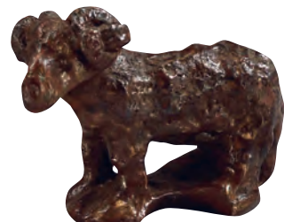
Widderfigürchen, Kinderspielzeug, 2./3. Jh. Figure of a ram, toy, 2nd/3rd century A.D.

Animationsfilme (u. a. zur Wasserversorgung Vindobonas), Repliken zum Angreifen und ein Playmobil®-Legionslager: Das Römermuseum lädt ein, das Leben der Römer mit allen Sinnen zu begreifen. Für vertiefende Informationen steht ein Videoguide (Deutsch, Englisch, Gebärdensprache) zur Verfügung.