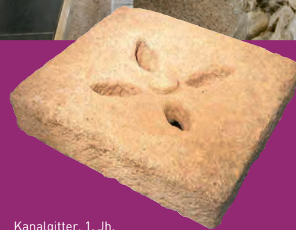
Kanalgitter, 1. Jh. Kalksandstein Sewer grate, 1st century AD, lime sandstone