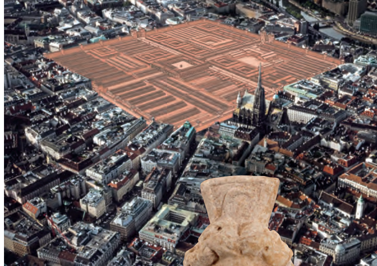
Ausdehnung des Legionslagers Extension of the Legionary Fortress