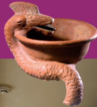
Schlangengefäß, 2./3. Jh. Snake vessel, 2nd/3rd century A.D.