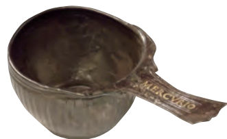
Kasserolle aus einem Tempelinventar, 2. bis Anfang 3. Jh. Casserole, temple inventory, 2nd to the beginning of 3rd century A.D.

In addition to their military duties, the approximately 6000 soldiers living in the camp engaged in administrative activities and worked in trades and crafts. The periods of peace were longer than those of warfare. The legionaries also enjoyed recreational facilities, from taverns and baths to brothels.