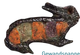
Gewandspange in Form eines Häschens, 2./3. Jh. Hare-shaped brooch, 2nd/3rd century A.D.