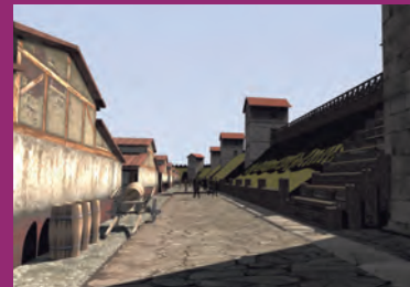
Rekonstruktion des Legionslagers Reconstruction of the Legionary Fortress Animation: 7reasons