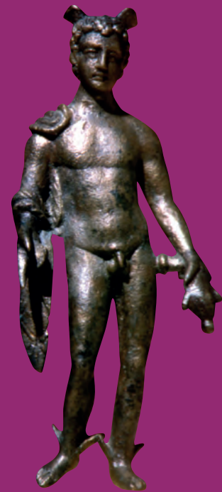
Merkurstatuette eines Hausaltars Statuette of Mercury from a house altar