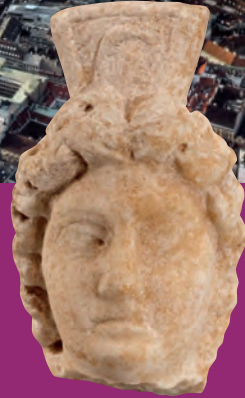
Geniusstatuette, Ende 2. bis Mitte 3. Jh. Genius Statue, end of the 2nd to the mid of 3rd century A.D.