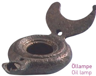
Öllampe Oil lamp