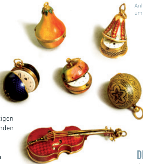
Anhängeruhren, um 1810

des Museumsbesuchs zählt die astronomische Kunstuhr von David a Sancto Cajetano aus dem 18. Jahrhundert. In sensationeller Genauigkeit gibt das technische Meisterwerk neben der Uhrzeit auch die Länge des Tages und die Umlaufzeit von Planeten an. Die weltberühmten Laternduhren sind Zeugen der Blütezeit der Wiener Uhrmacherkunst. Die kleinste Uhr ist ein „Zappler“ und passt unter einen Fingerhut, das schwerste Exemplar ist die Turmuhr des Stephansdoms aus solidem Eisenguss. In vielfältigen Beispielen sind Wiener Biedermeier und Belle Époque repräsentiert.