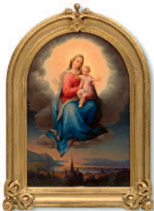
Leopold Kupelwieser, Madonna und Kind über Wien schwebend, 1855 Ankauf 2012

Gezeigt werden bedeutende Erwerbungen aus jüngster Zeit, Kunstwerke ebenso wie historische Objekte. Im Erdgeschoss sieht man eine Reisetruhe von Johann Strauß oder neu in die Sammlung gekommene Gemälde aus dem 19. Jahrhundert – u. a. von Leopold Kupelwieser und Makart. Im ersten Stock sind Zeugnisse der Zeitgeschichte wie ein Belüfter aus einem Luftschuttkeller, aber auch Sonnenbrillen aus dem 19. Jahrhundert zu sehen. Im Sonderausstellungsraum im zweiten Stock: die Schenkung Bogner.