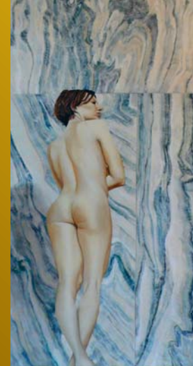
Rosa Albach-Retty, 1917 A. E. Bundestheater-Holding © Burgtheater