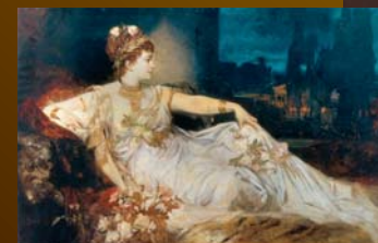
Charlotte Wolter als „Messalina“, 1875 Hans Makart Wien Museum