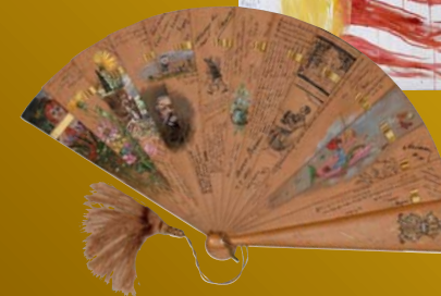
Autogrammfächer, um 1900 Wien Museum