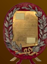
Ehrentafel, 1890 anlässlich des 25-jährigen Burgtheaterjubiläums von Fritz Krastel Wien Museum