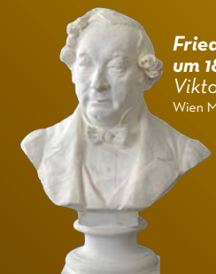
Friedrich Beckmann, um 1880 Viktor Tilgner Wien Museum